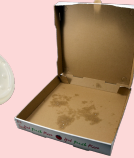
cajas de pizza grasientas