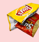
envases de plástico