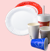
platos y vasos de papel