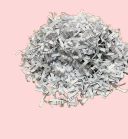
papel en trizas