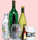
botellas de vidrio