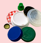
todas las tapas