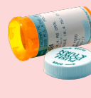
botellas de prescripción