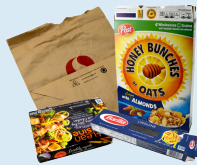
cajas y bolsas de papel