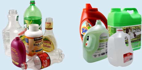
botellas y jarras (boca más pequeña que la base)

Recicla los plásticos por forma. Ignorar números y símbolos en el empaque.