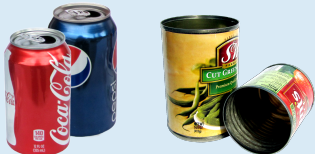
latas de aluminio